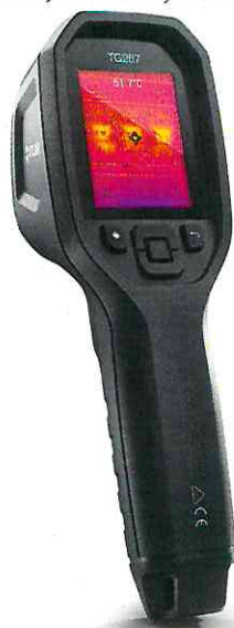
Рисунок 1 - Общий вид пирометров модели TG267

Фотографии общего вида пирометров инфракрасных тепловизионных FLIR серии TG моделей TG267, TG275, TG297 приведены на рисунках 1-4.