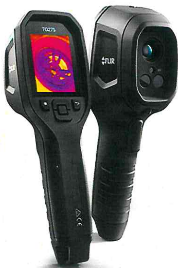
Рисунок 3 - Общий вид пирометров модели TG275