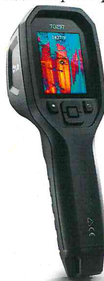
Рисунок 4 - Общий вид пирометров модели TG297

Пломбирование пирометров не предусмотрено.