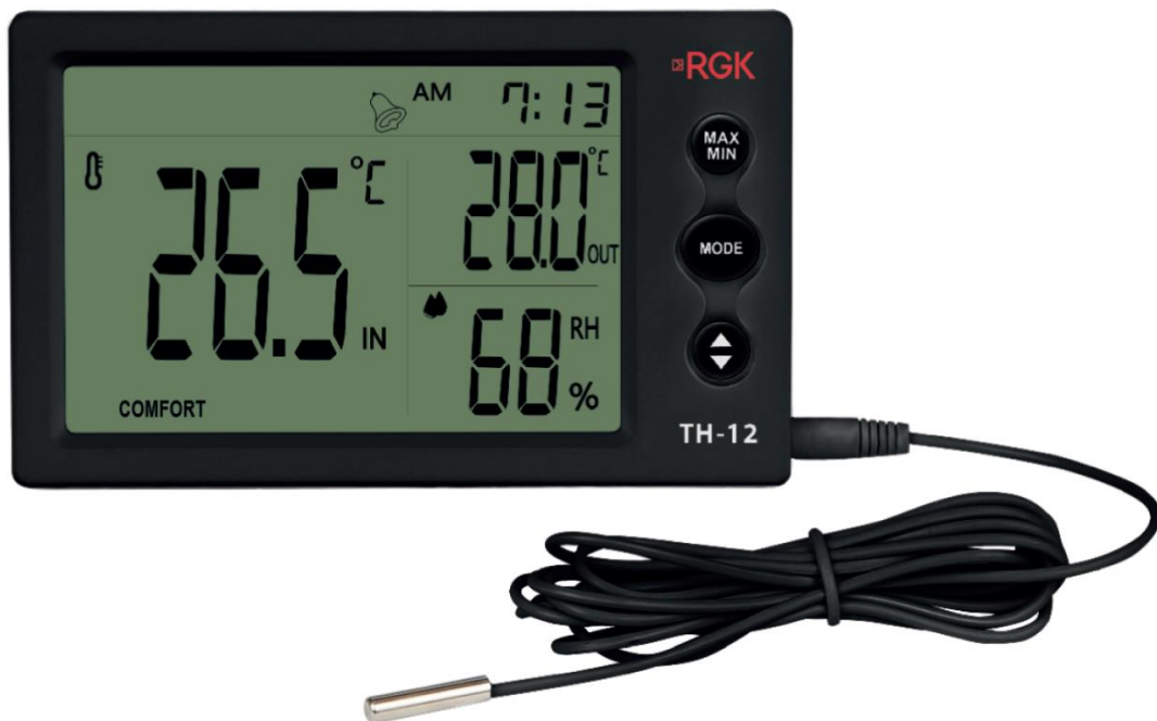
Рисунок 2 – Общий вид термогигрометров RGK модели TH-12 (с внешним датчиком)