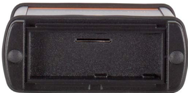
Рис. 4. Слот для вставки SIM-карты. Вид сверху.

Перед подключением GSM модема к питанию и GNSS приемнику установите SIM-карту сотового оператора в соответствующий слот, который находится под крышкой в верхней части модема.