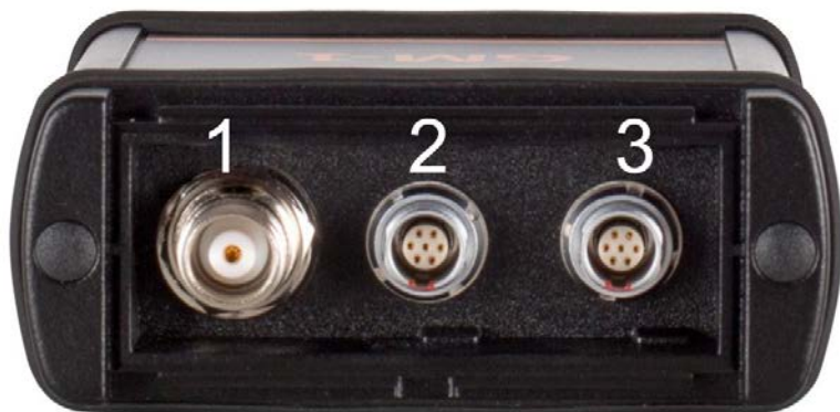
Рис. 2. Панель с разъемами для подключения внешних устройств