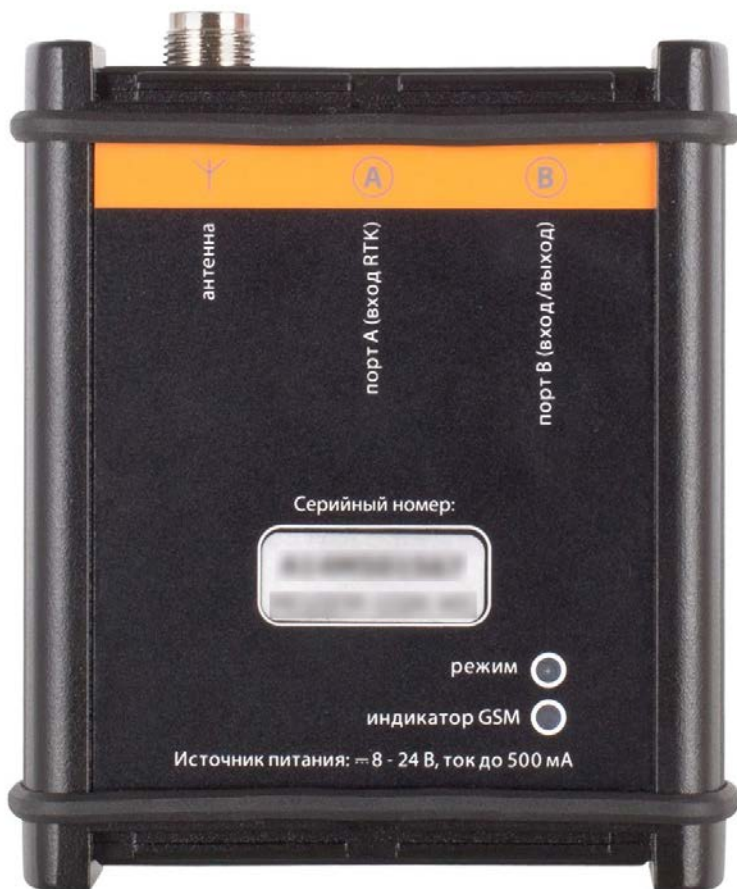
Рис.1. Внешний вид модема